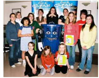
Les gagnants de 2008 avec Moby

RRFB Nouvelle-Écosse organise son 10 e Concours annuel la Nouvelle-Écosse recycle qui est ouvert à tous les élèves de la maternelle à la 12 e année. Il y a plus de 55 000 $ en argent comptant et en prix, y compris 500 $ pour les écoles des élèves gagnants. Des bourses sont aussi disponibles dans la catégorie de la 12 e année. Il y a 20 000 $ disponibles en bourses régionales, y compris une bourse de 5 000 $ pour la meilleure dissertation provinciale en 12 e année. Les trousseaux du concours seront envoyés aux écoles en octobre. Pour de plus amples renseignements, prière de visiter au www.rrfb.com .